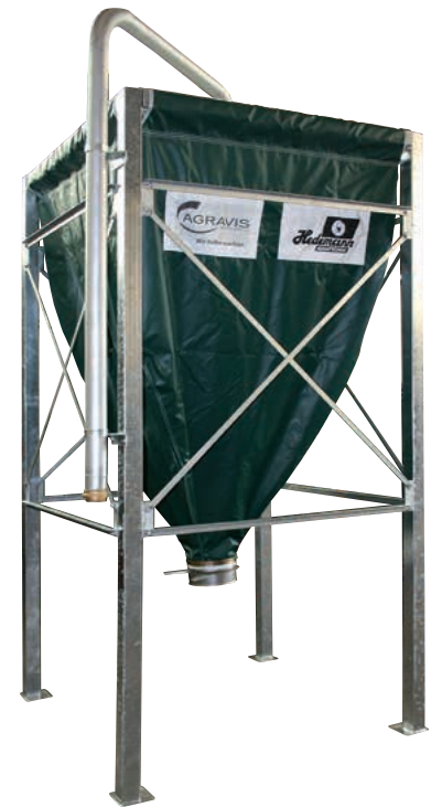
Mineralfutter-Silo Typ 15–22 Inhalt ca. 3,5 m 3 = 3,5 t bei 1,0 t/m 3

Für eine optimale Lagerung Ihres Mineralfutters bieten wir Ihnen zwei Modelle zur sicheren und trockenen Aufbewahrung an.